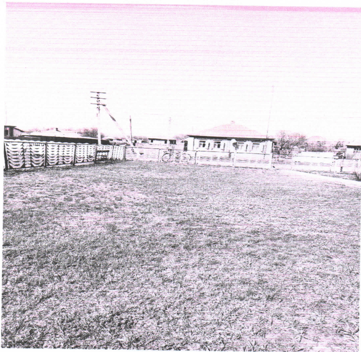
8. 2. Визуализация будущего проекта